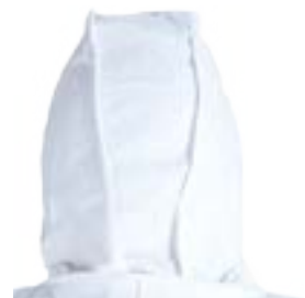
Capuche 3 pièces pour une liberté de mouvement