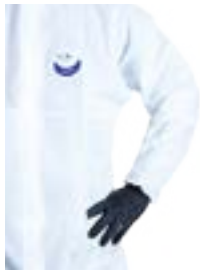
Manche raglan pour plus d'aisance